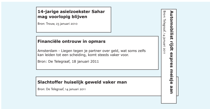
Figuur 1.2 Krantenberichten rondom moraliteit

Als je met deze wetenschap nogmaals in de kranten kijkt, zie je dat deze vol staan met gebeurtenissen waarin de moraliteit een rol speelt. Gebeurtenissen waarin de manier hoe mensen met elkaar omgaan, centraal staat.